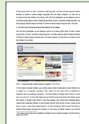
Abbildung im Fließtext